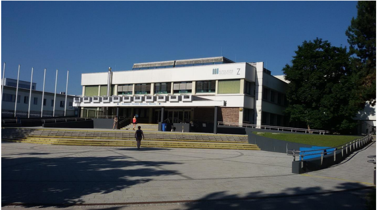
Abbildung 1 Universität Zentralgebäude

Studiengang: M.Sc. Soziologie und empirische Sozialforschung Gastuniversität: Alpen-Adria-Universität Klagenfurt Gastland: Österreich