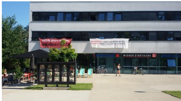
Abbildung 2 Sparkasse im ÖH Gebäude

Ich entschied mich für das Nautiluswohnheim, da ich dort für den Zeitraum vom 29.02 bis 30.06 ein Einzelzimmer mieten konnte. Es war für mich ein sauberes Wohnheim und ich kam gut mit meinem Mitbewohner zurecht. Die Türen lassen sich mit einem elektronischem Schlüssel öffnen. Im Falle des Aussperrens konnte der Key Holder kontaktiert werden, der alle Türen öffnen kann. Im Zimmer selber befand sich ein Safe und ein kleiner Fernseher. WLAN gab es auch im gesamten Gebäude und eine Waschmaschine stand für eine Gebühr von zwei Euro auch zur Verfügung. Ich empfand es als sehr angenehm einen kurzen Fußweg zur Universität zu haben. Außerdem waren die Ansprechpartner immer gut erreichbar und zuverlässig. Zudem verfügt das Nautiluswohnheim über eine Dachterrasse, die einen schönen Blick auf die Umgebung bietet. Das einzige Manko ist, dass zur Bezahlung ein Österreichisches Konto eingerichtet werden muss. Bei der Sparkasse (siehe Abbildung 2), die sich auf dem Campus befindet, ist das Einrichten eines Bankkontos ohne weiteres schnell möglich. Mit der Bankkarte kann dabei an jedem Bankautomat in Österreich kostenfrei Geld abgehoben werden.