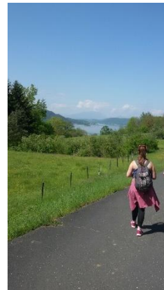
Abbildung 7 Tageswanderung in der Nähe der Universität

Studentensteg (kostenlos) zum Baden genutzt werden. Die kleinen Lokale wie der Uni-Wirt (siehe Abbildung 6) bieten zudem die Möglichkeit, den Abend nett mit Freunden ausklingen zu lassen. Im Sommer findet außerdem der Iron Man und der Grand Slam (Beachvolleyball) statt, die eine eigene Attraktion sind.